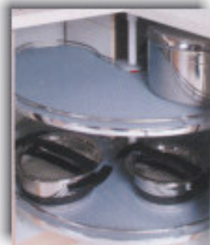
Ikke rektangulære former